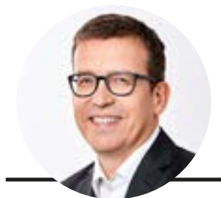
AUTOR MAX MUSTERMANN POSITION UND NAME DER FIRMA