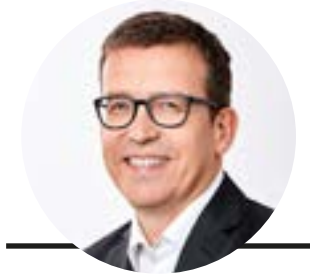
AUTOR MAX MUSTERMANN POSITION UND NAME DER FIRMA